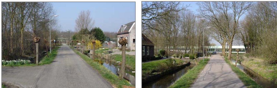
Afbeelding 3: Zicht over Zuiderpad en Noorderpad richting snelweg A7

bijzondere situatie van het dorp Zuidoostbeemster verder versterkt. Het zicht over het Zuiderpad, de Zuidersloot, het Noorderpad en de Volgerweg werd door de snelweg en later door de geluidschermen verstoord.