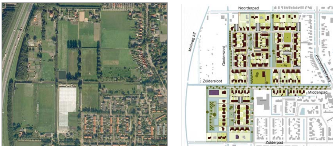
Afbeelding 4: foto gebied De Nieuwe Tuinderij West (1999) en stedenbouwkundig plan (SVP)

Met dit plan wordt de historische en landschappelijke structuur van wegen en sloten versterkt en op een passende wijze opgenomen in het nieuwe woonlandschap.